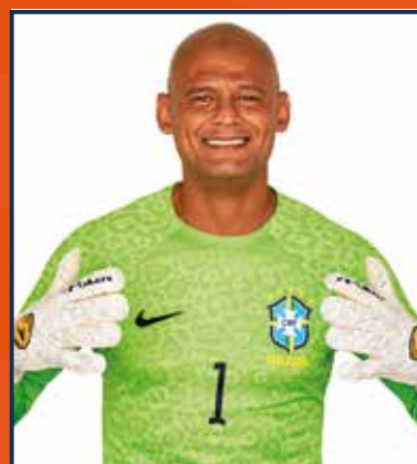
MÃO 5X COPA DO MUNDO MELHOR GOLEIRO DA HISTÓRIA