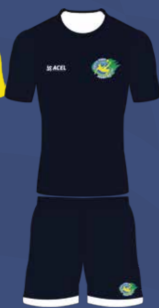
UNIFORME DO COLABORADOR