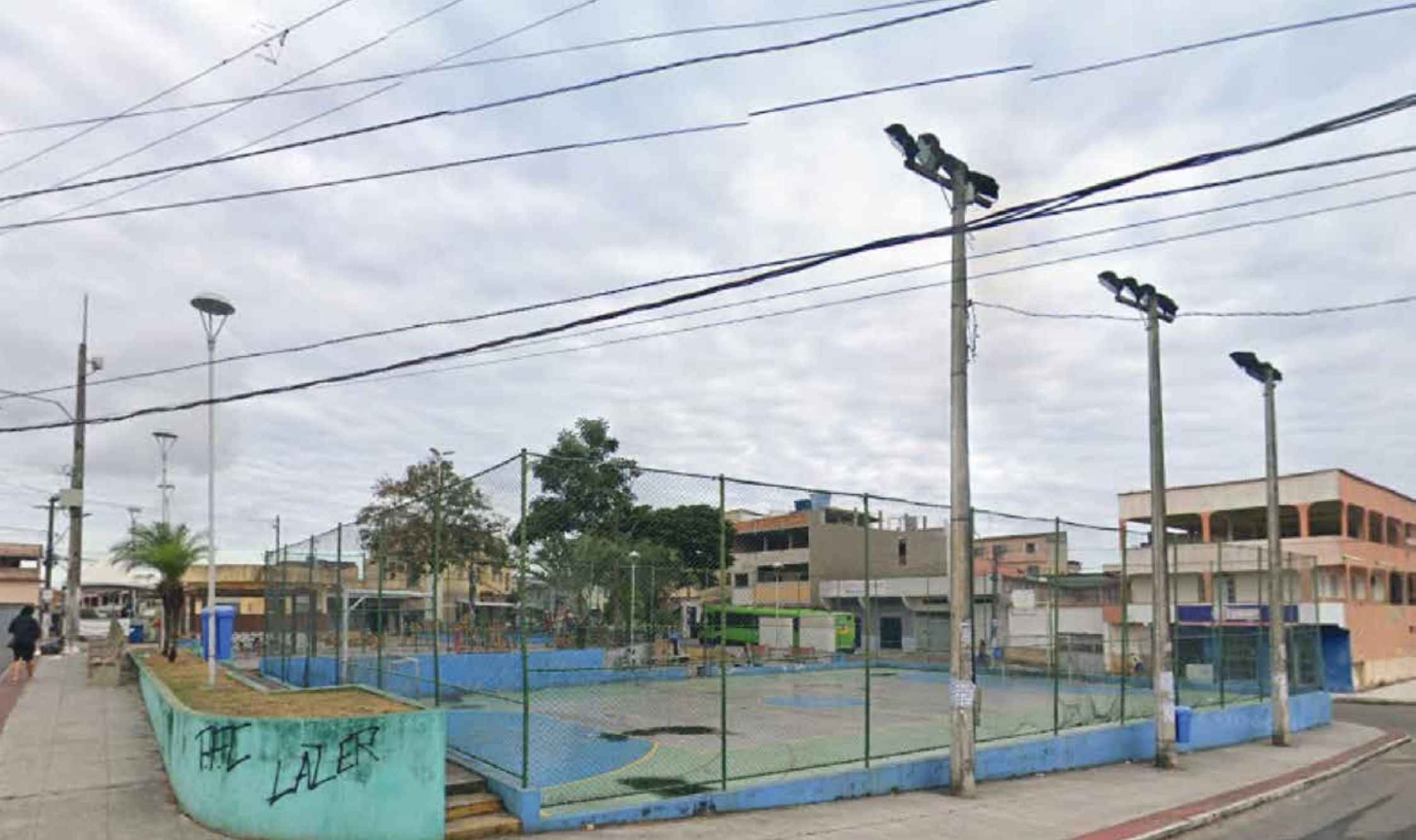
Quadra Poliesportiva - Carapina Grande