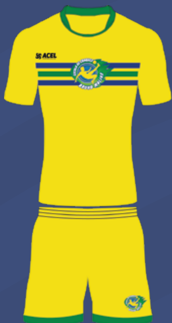
UNIFORME DE TREINO