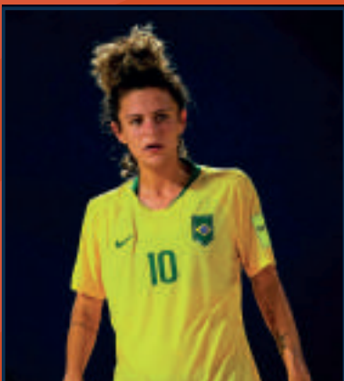
LELÊ VILLAR INDICADA A MELHOR DO MUNDO