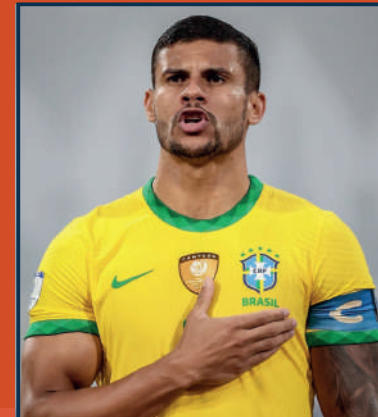
BRENDO CHAGAS CAPITÃO DA SELEÇÃO E CAMPEÃO BRASILEIRO